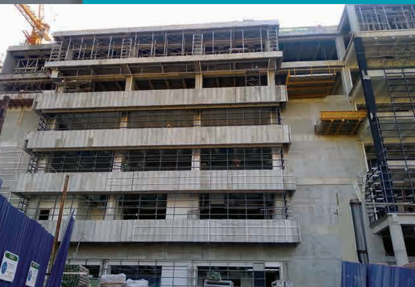
上图:2019年年初的扩建工程